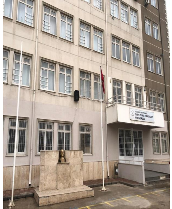
Atatürk Büstü ve Ana Giriş Kapısı