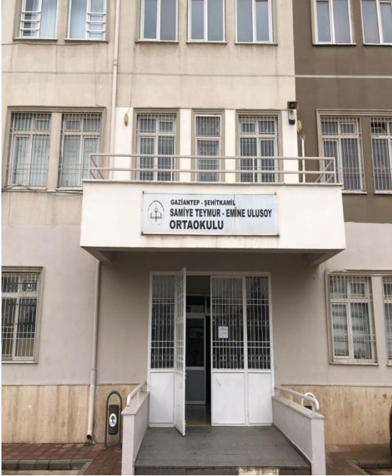
Ana Giriş Kapısı